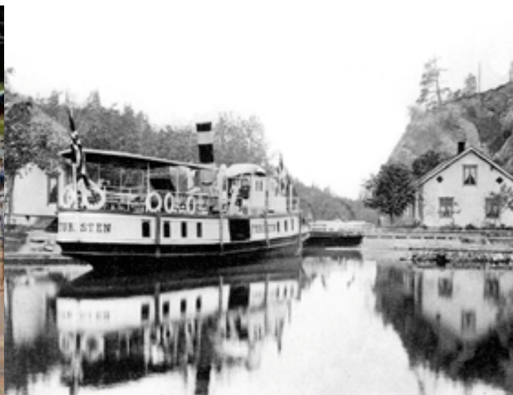
DS «Turisten» ved Krappeto på begynnelsen av 1900-tallet.

En tur på Haldenkanalen er en opplevelse for alle menneskets sanser. Turen byr på masse spennende historie, levende fortalt i ord og bilder om bord.