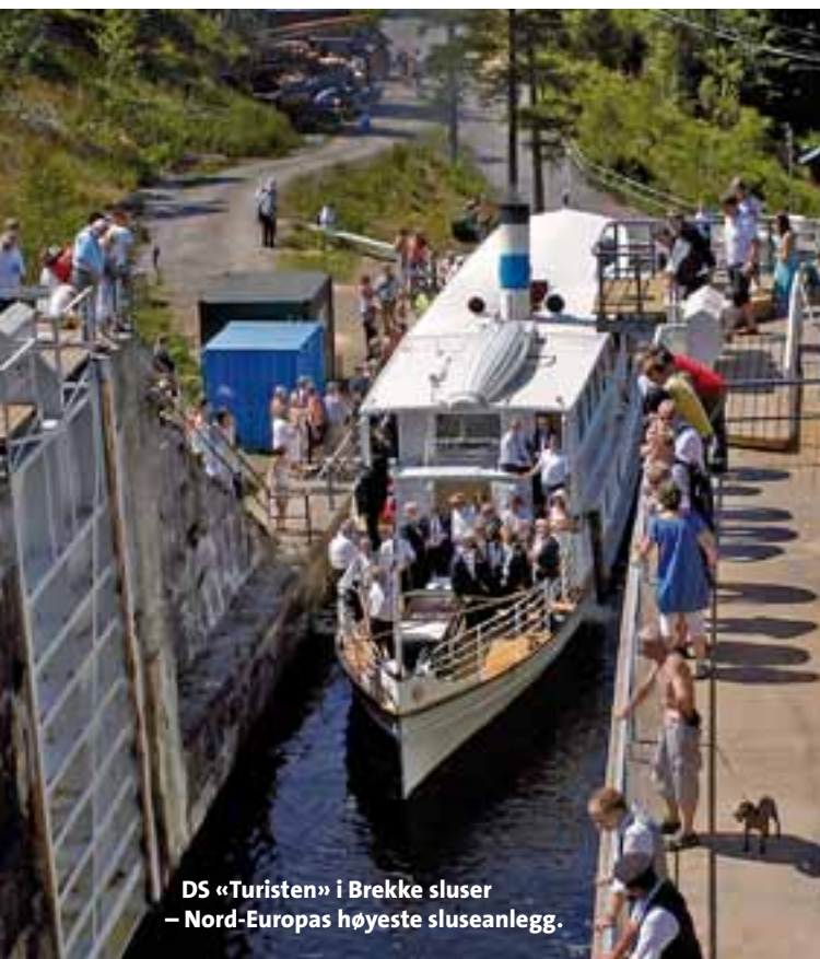
DS «Turisten» i Brekke sluser – Nord-Europas høyeste sluseanlegg.