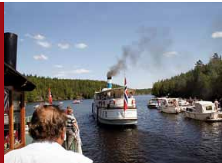
Dampskipet «Turisten» vekker oppsikt overalt på sin ferd gjennom Haldenkanalen.