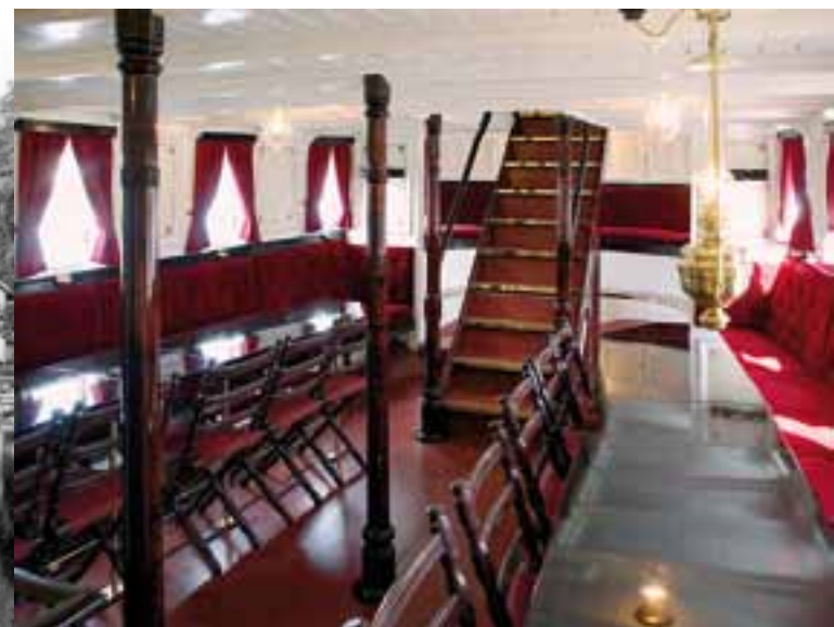
Den vakre salongen om bord i DS «Turisten» byr på klassisk messing, mahogny og plysj.

I 1898 kom Urskog–Hølandsbanen, en smalsporet jernbane, til Skulerud. Det ble et gjennombrudd for