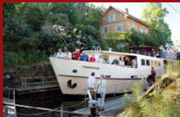
MS «Strømsfoss» ble kjøpt fra Tyskland til Haldenkanalen i 1985. Motorskipet hadde strategiske mål som passet inn i sluser og kanaler. Med dampskipet på 40 meters dyp, var det naturlig å døpe motorskipet «Turisten». Nå er dampskipet tilbake, og motorskipet vil heretter seile under et nytt stolt navn; MS «Strømsfoss».